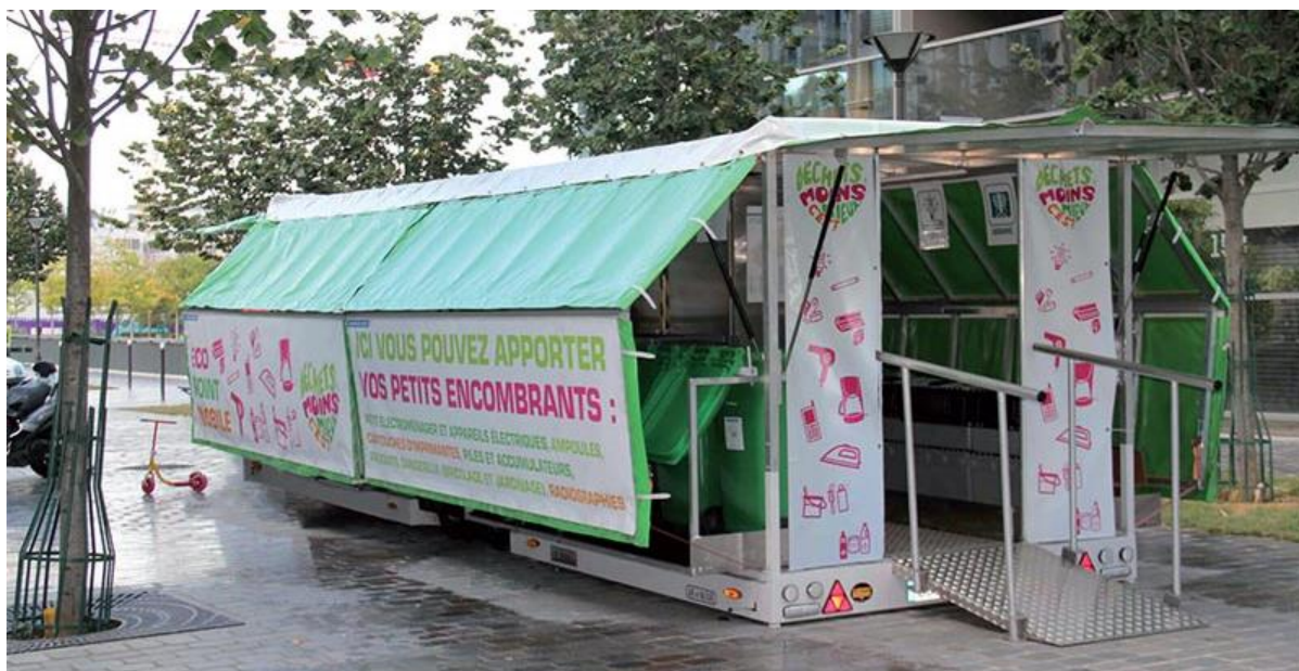
Exemple d'Eco-point à Paris

Cette remorque sera aussi très facilement visitable par les classes en se garant aux abords des écoles. Ce sera ainsi un outil pédagogique important en plus d'une solution de tri au plus près des audoniens.