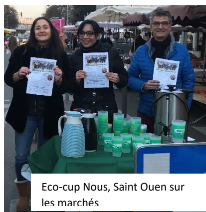
Eco-cup Nous, Saint Ouen sur les marchés

Les arrêtés sont un signal important vis-à-vis des habitants pour éviter que, lors des pique-niques ou goûter dans les parcs, les pelouses soient polluées. Par ailleurs notre programme encourage fêtes de quartier et brocantes et autres événements qui créent du lien (Engagement #27). Ces événements doivent être autorisés sans recours au plastique jetable et en limitant le jetable même recyclable (eco-cup au lieu de gobelet par ex.).