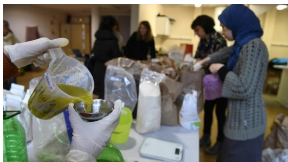
Distribution de l'association Vrac à développer à St Ouen.

La politique de développement du commerce de proximité (engagement #11) vient répondre à une attente forte de primeurs, cafés associatifs où peut se développer la vente en vrac. L'idée est de mettre en place, dans les coques commerciales propriétés de la SEMISO des loyers progressifs ou adaptés permettant d'accueillir ce type d'activité. La mise en place d'un marché nocturne hebdomadaire, place de la Mairie (engagement #27), sera aussi une opportunité de développer le vrac.